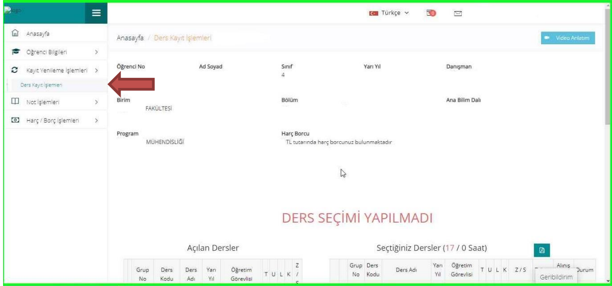
Resim 2- Kayıt Yenileme (Ders Seçme) İşlemleri Sayfası

3. Açılan Kayıt Yenileme (Ders Seçme) İşlemleri ekranında “Açılan Dersler” bölümünden seçebileceğiniz dersleri görebilir ve aynı ekrandan kayıt yaptırmak istediğiniz dersleri seçerek “Seçilen Dersleri Ekle” butonu vasıtasıyla ders seçim işlemi tamamlayabilirsiniz. Alt yarıyıldarda alınan ve başarısız olunan tekrar dersleri sistem tarafından zorunlu olarak seçilmekte olup bu dersler ders kaydından çıkarılamaz.