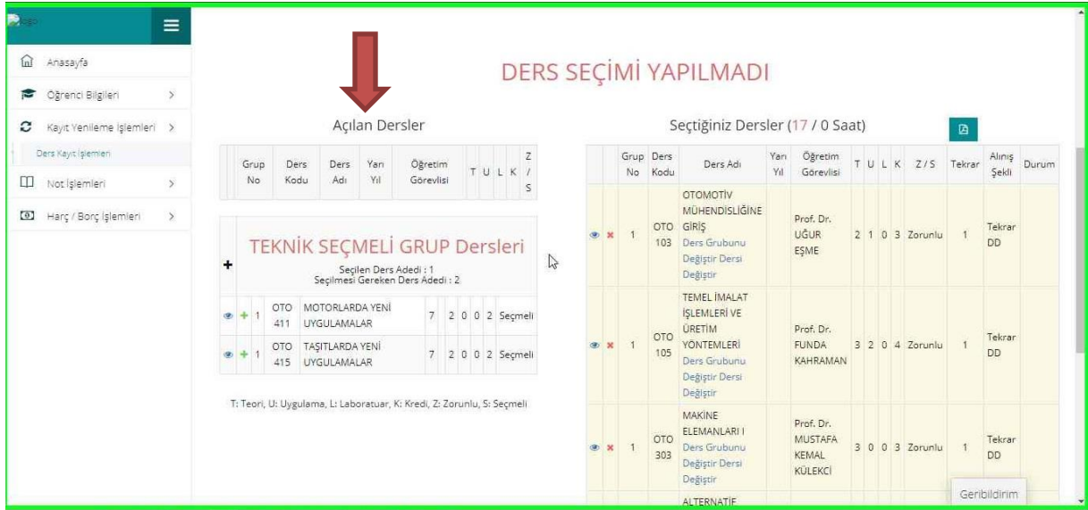
Resim-3 Derslerin Seçim Ekranı

3. Açılan Kayıt Yenileme (Ders Seçme) İşlemleri ekranında “Açılan Dersler” bölümünden seçebileceğiniz dersleri görebilir ve aynı ekrandan kayıt yaptırmak istediğiniz dersleri seçerek “Seçilen Dersleri Ekle” butonu vasıtasıyla ders seçim işlemi tamamlayabilirsiniz. Alt yarıyıldarda alınan ve başarısız olunan tekrar dersleri sistem tarafından zorunlu olarak seçilmekte olup bu dersler ders kaydından çıkarılamaz.